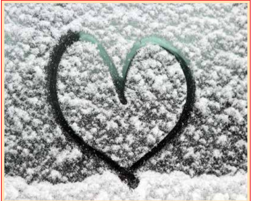
Зимна любов Снимка на месеца